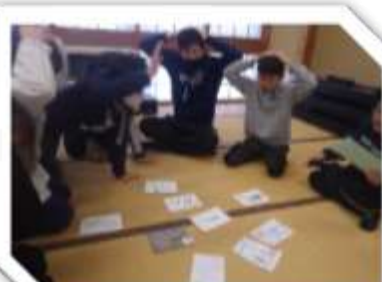
健康カルタ大会 1/12 (金)