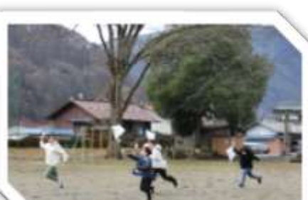
全校たこあげ 1/22 (月)