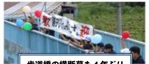
歩道橋の横断幕も4年ぶり