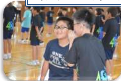
伝言ゲームにドッジボールで親睦を深めました