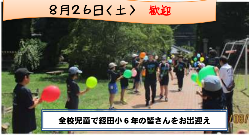
全校児童で経田小6年の皆さんをお出迎え