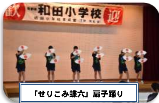
「せりこみ蝶六」扇子踊り

お出迎えの皆さんがずらりと学校までの道沿いに並んでいる中、経田小学校へ到着！画面越しではない対面に、お互いちょっと照れつつも、まずは全員で集合写真。